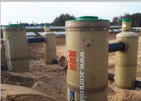
Индустриальный парк "Великий камень" "Оборудование для очистки поверхностного стока в составе ЛОС накопительного типа с самым большим в мире безбетонным аккумулирующим резервуаром АСО StormBrixx, Минск, Республика Беларусь